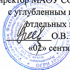
График родительского контроля организации питания в школьной столовой